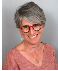
Titulaire CSE CSSCT Carmes