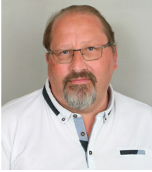
Titulaire CSE CSSCT Combaude