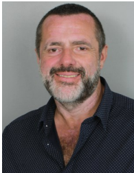
Titulaire CSE CSSCT Ladoux